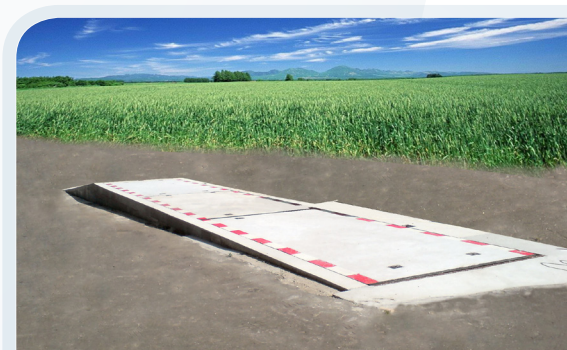
Úrovňová mostová váha