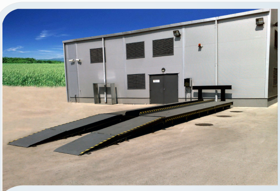
Nadúrovňová mostová váha

Ukladaním jednotlivých mostov za sebou možno vytvoriť mostové váhy s rozmermi napr.: